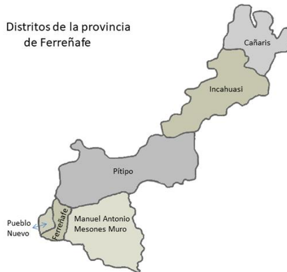
FIGURA N° 02 DISTRITOS DE LA PROVINCIA DE FERREÑAFE